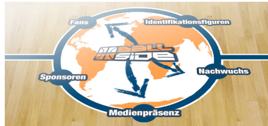
Abbildung: Der Basketball-Teufelskreis am Beispiel Deutschlands.